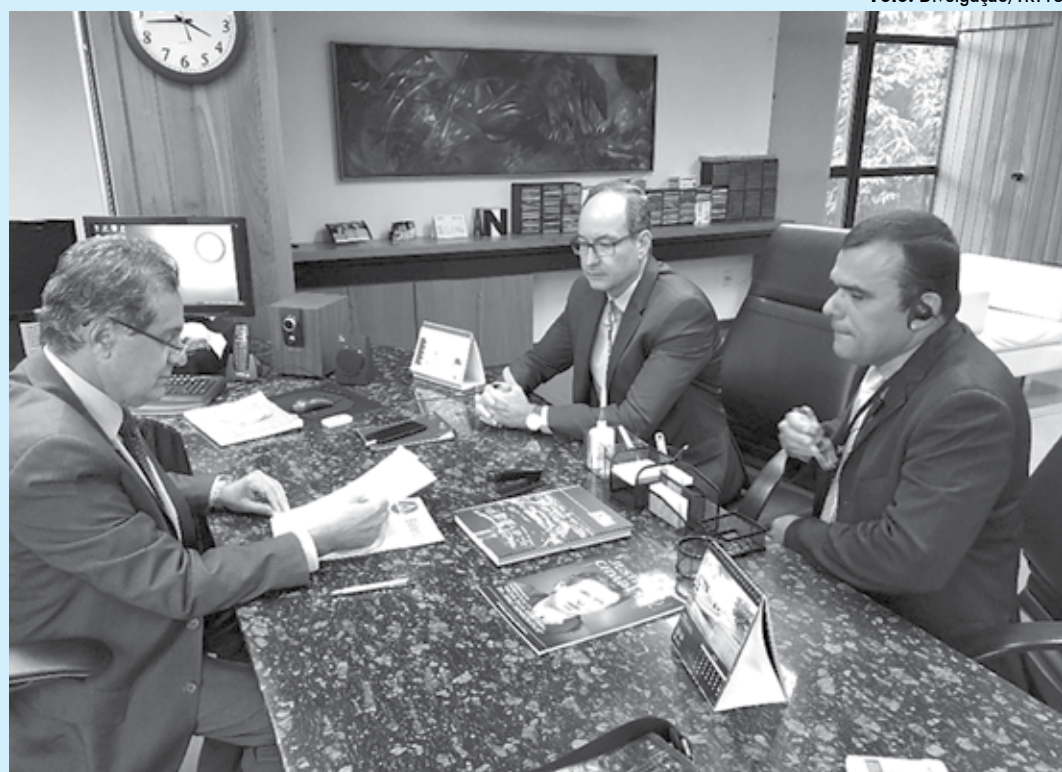
Objetivo é promover ações de parcerias, conscientização e diálogos com integrantes da Polícia Militar, através de aulas e oficinas

como a exploração sexual e comercial de crianças e adolescentes, assim como o trabalho para o tráfico e no comércio ambulante no trânsito. Apesar desses serviços serem prestados em locais abertos, ainda não são combatidos com eficiência, ante à ausência de políticas públicas eficazes para solucionar o problema", destaca o projeto do TRT13.