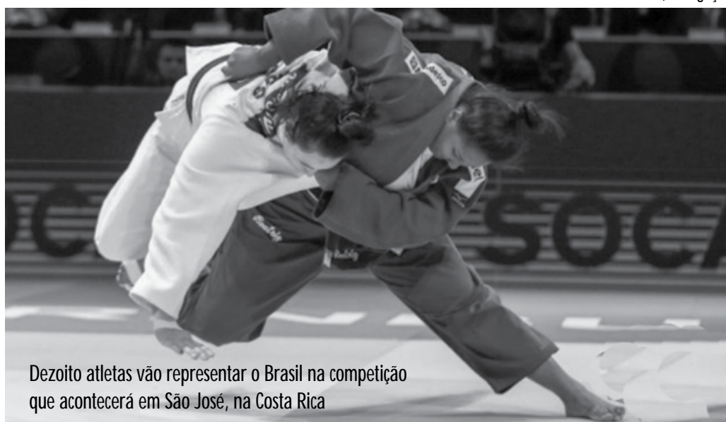
Dezoito atletas vão representar o Brasil na competição que acontecerá em São José, na Costa Rica