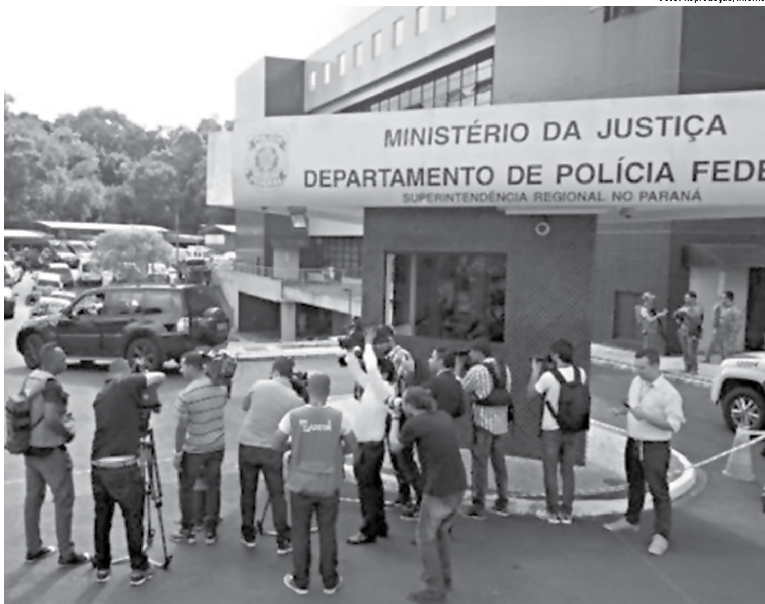
O ex-presidente Lula está preso na Superintendência da PF em Curitiba, mas pode ser transferido por causa das manifestações e grande movimentação

O SinDPF/PR diz na nota que o bloqueio de acessos está "causando graves inconvenientes e atrasos nos atendimentos e ações policiais" e que por conta disto os policiais federais envolvidos nesta operação de segurança estariam "sem poder