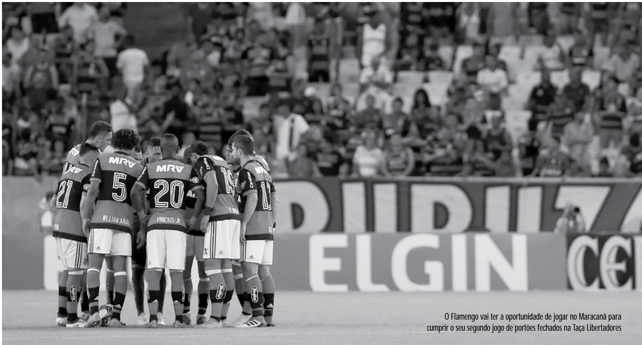
O Flamengo vai ter a oportunidade de jogar no Maracanã para cumprir o seu segundo jogo de portões fechados na Taça Libertadores