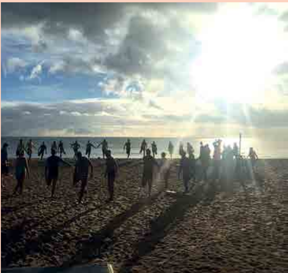
Aulas acontecem às terças-feiras e quintas-feiras, das 6h às 7h e das 7h às 8h, no Cabo Branco

O Projeto Mais Natação do Governo do Estado, desenvolvido pela Secretaria de Estado do Desenvolvimento Humano (SEDH), em parceria com a Associação Amigos da Natação do Mar, está completando nesta semana três anos de atividades. Para comemorar a data, a SEDH ofereceu um café da manhã para os frequentadores do projeto.