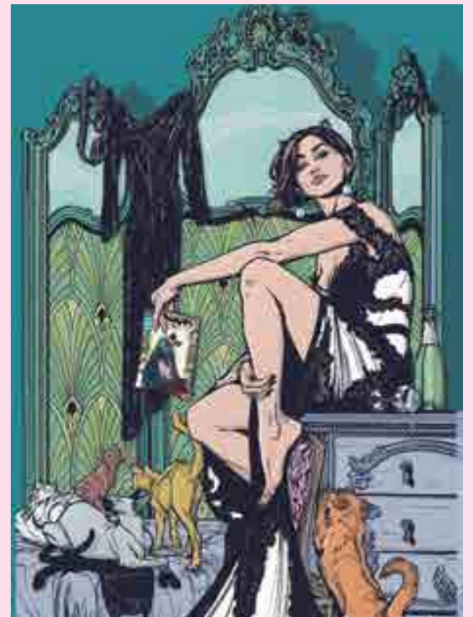
Publicação tem previsão de ser lançada em julho nos Estados Unidos

O lançamento é previsto para o dia 4 de julho.