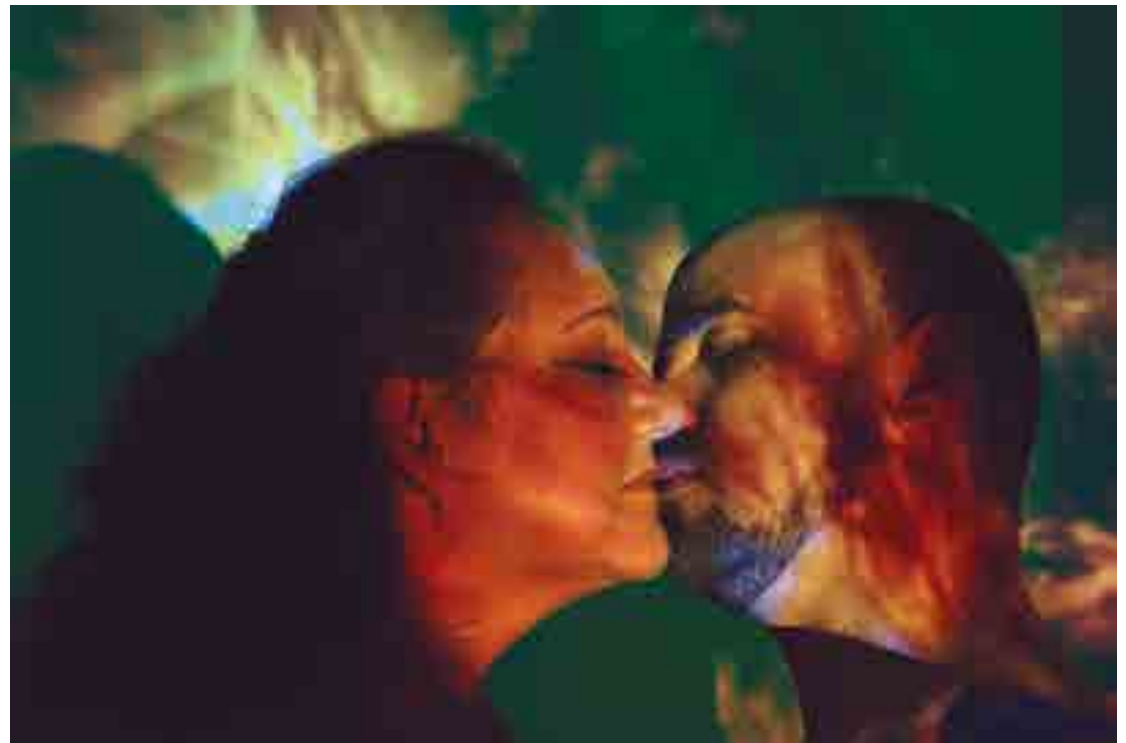
Os espetáculo 'Eles Não Usam Tênis Naique', da 'Cia. Marginal', grupo teatral atuante há mais de uma década no Rio de Janeiro; e 'O Último Édipo', que é um romance inspirado no texto dramaturgico de W. J. Solha, compõem a programação