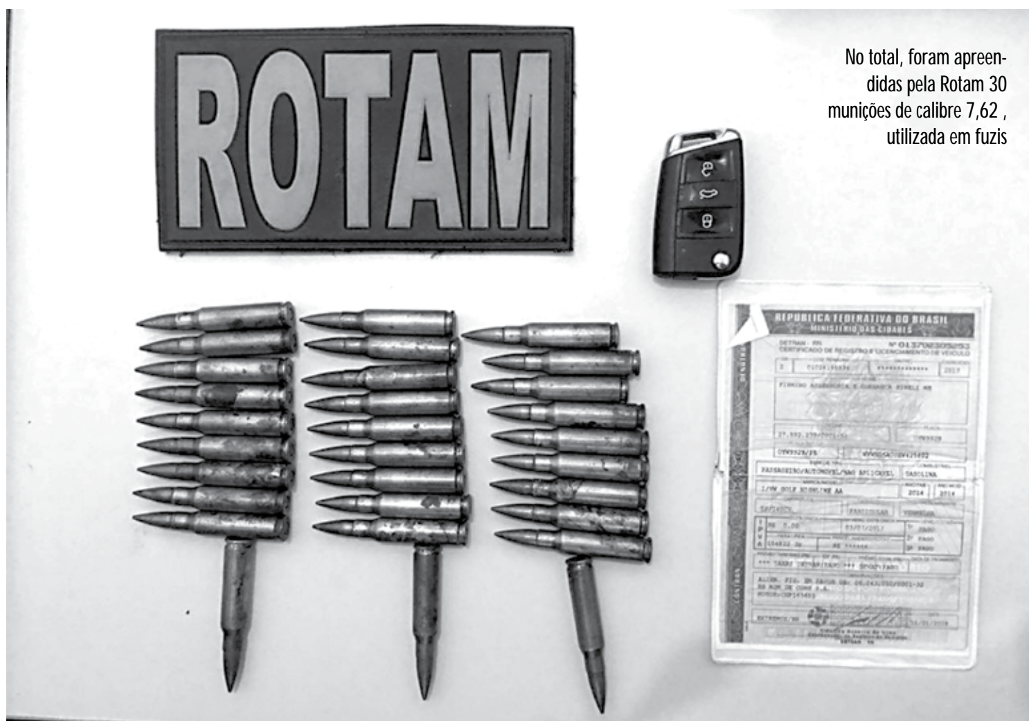
No total, foram apreendidas pela Rotam 30 munições de calibre 7,62, utilizada em fuzis

Mais tarde, policiais da Força Regional apreenderam seis pedras de substância semelhante ao crack, três trouxas de maconha e dois papéletes de cocaína que estavam com um homem de 18 anos, abordado no José Pinheiro. O suspeito foi conduzido para a delegacia para os procedimentos cabíveis.