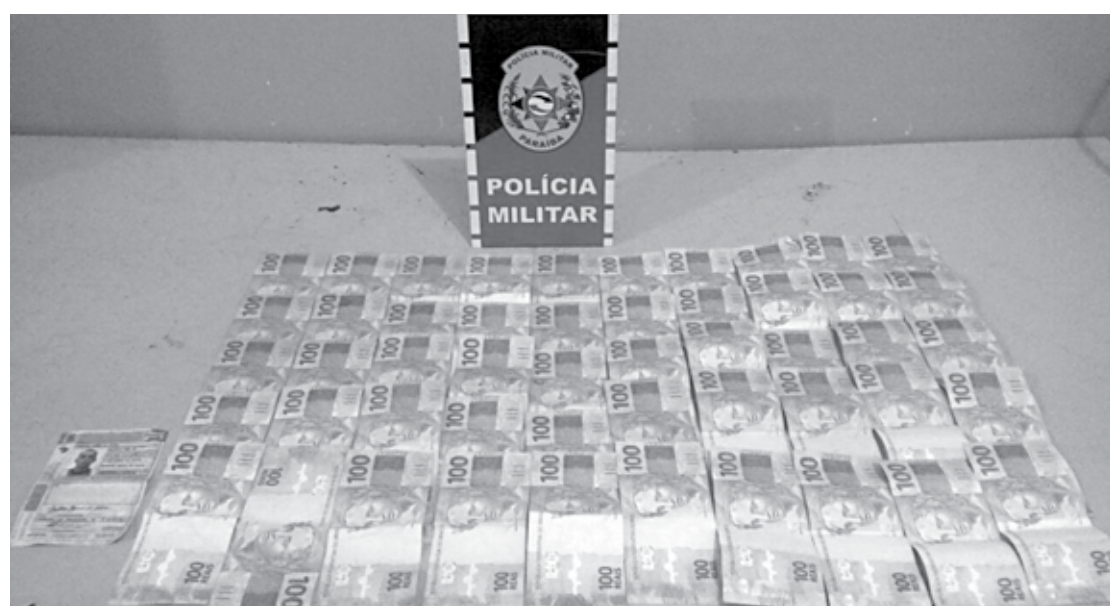
Durante abordagem, os policiais encontraram R$ 5 mil em notas de cem com um dos suspeitos de crimes

Segundos os policiais que atenderam a ocorrência, o suspeito disse que vinha do Estado de Pernambuco. O acusado foi encaminhado para a 6ª Delegacia Distrital para os procedimentos legais.