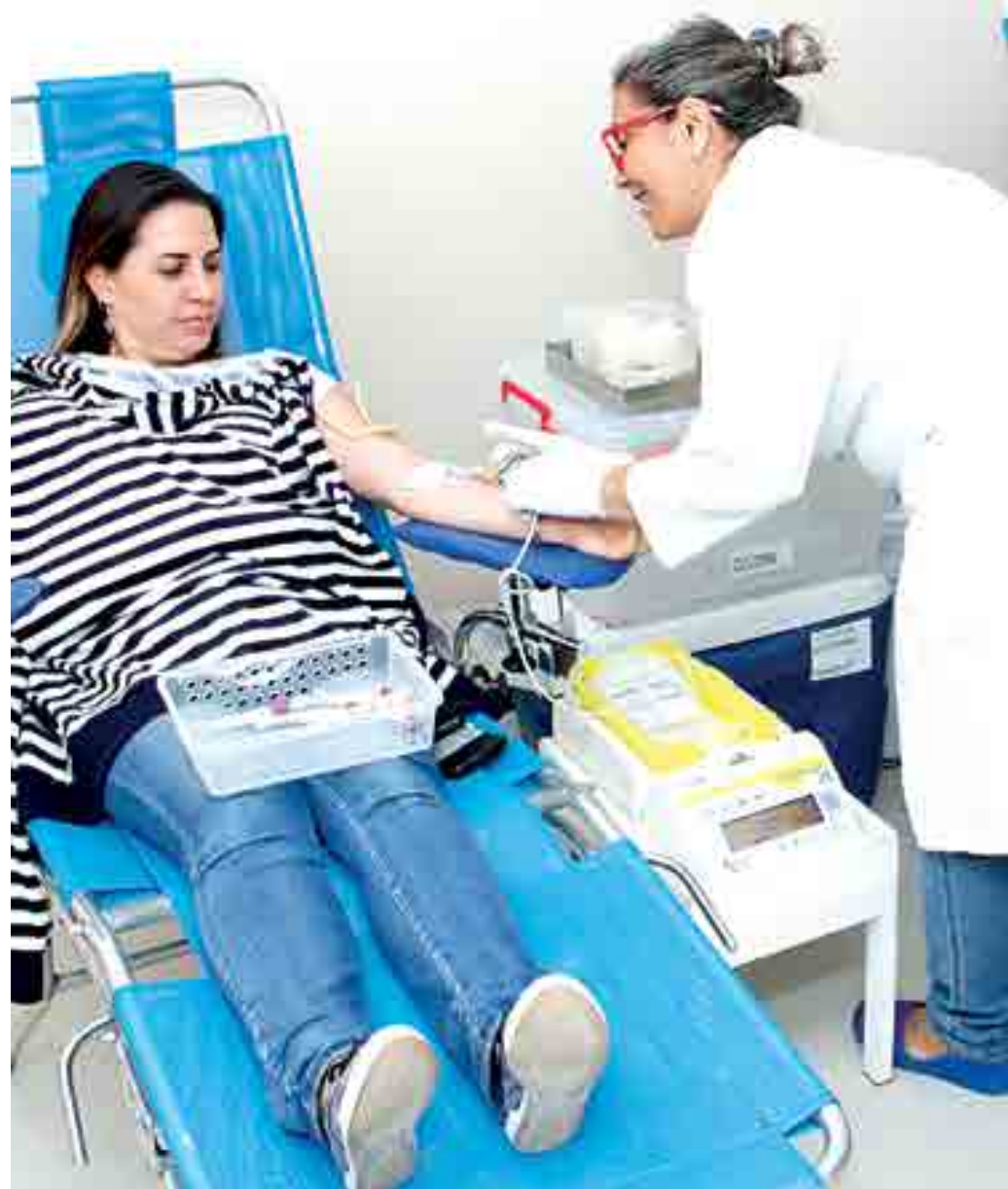
Adesão à campanha de doação conseguiu 18 bolsas de sangue que foram coletadas dos próprios funcionários