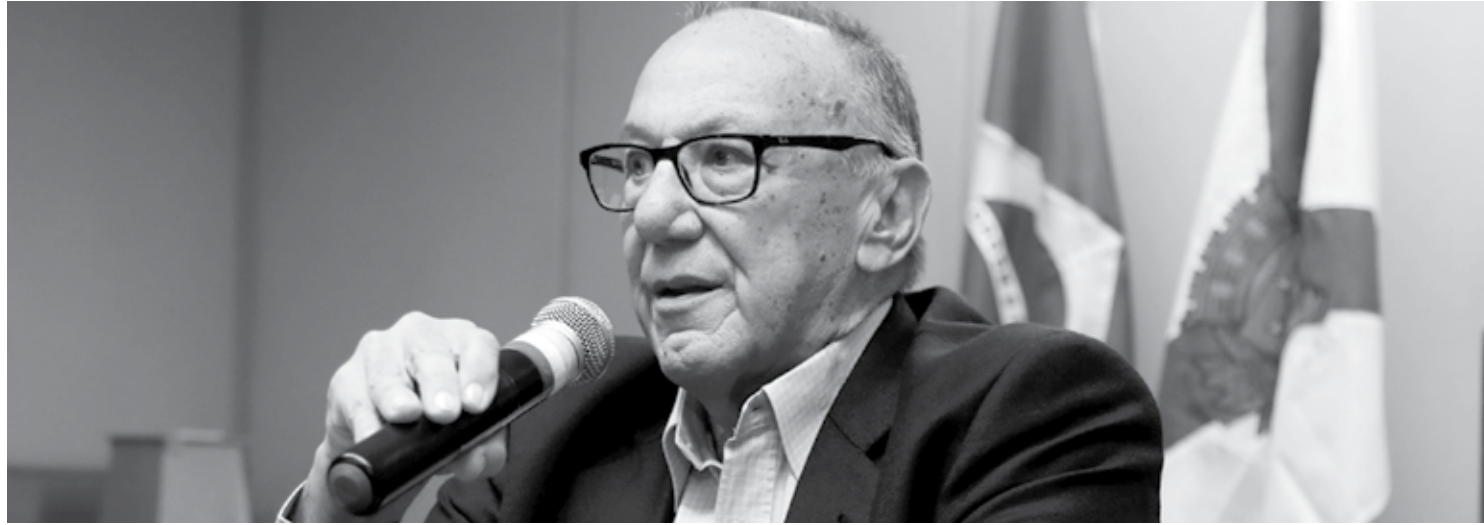
O presidente da Confederação Brasileira de Desportos Aquáticos tenta administrar a crise motivada por corrupção na gestão passada em relação a contratos